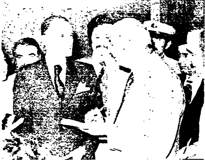
الشيخ بيار الجميل بعد مقابلة الرئيس فرنجية امس